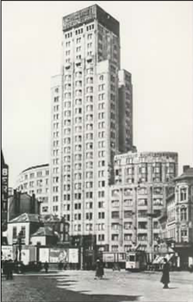
Figuur 2: Het voltooide torengebouw, tussen 1932 en 1934