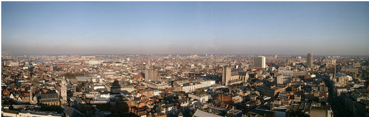
Figuur 4: Zicht vanuit de Boerentoren

Voor de bevoorrading van de toren zelf en als voorraad bij eventuele bluswerkzaamheden werd op de 25e verdieping een gigantische koperen waterbak voorzien met een inhoud van 230 m 3 . Het waterpeil wordt continu op niveau behouden bij middel van elektrische pompen in de onderkelders. Voor het koperen reservoir werden 900 m 2 koperplaat gebruikt met een totaal gewicht van 7 ton.