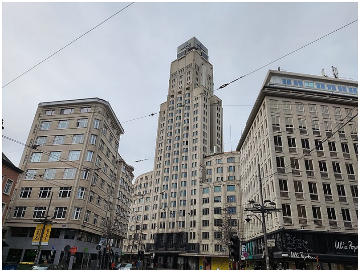
Figuur 3: De Boerentoren gezien vanop de Meir

De Boerentoren was gepland als een multifunctioneel gebouw met ruimte voor de kantoren van de bank, winkels en horecazaken, maar in essentie was het gebouw bedoeld als een woontoren met appartementen. Op de gelijkvloerse verdieping was er de lokettenzaal van de bank. Deze zaal was twee verdiepingen hoog en werd op de eerste verdieping omringd door een galerij met kantoren. Het plafond werd uitgewerkt als een grote lichtkoepel. Vanuit de lokettenzaal leidde een brede trap met een leuning van verchroomd koper naar de kluizen in de kelder.